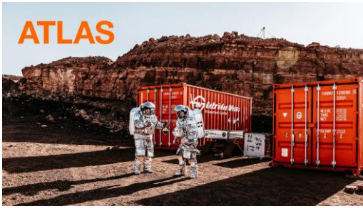
Bildunterschrift: Gebrüder Weiss fördert zukunftsweisende Mobilitätsprojekte – hier: die 13. Mars-Analog-Mission in Israel.