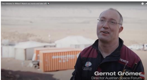
Video: Hier geht's zum Video Two minutes to #Mars? über die Mars-Analog-Mission und die Logistik dahinter. (Quelle: Gebrüder Weiss)