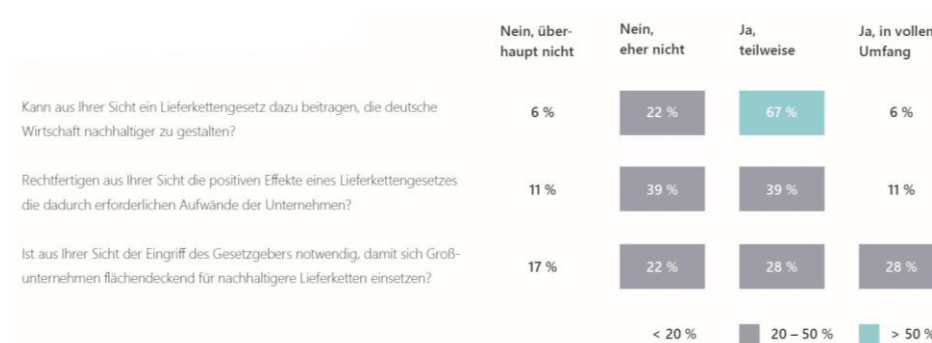
Abbildung 2: Einschätzung des Nutzens des Lieferkettengesetzes

Neben der Erfüllung der gesetzlichen Anforderungen wurde in der Studie auch untersucht, wie die Entscheidungsträger der betroffenen Unternehmen das Lieferkettengesetz als solches einschätzen: